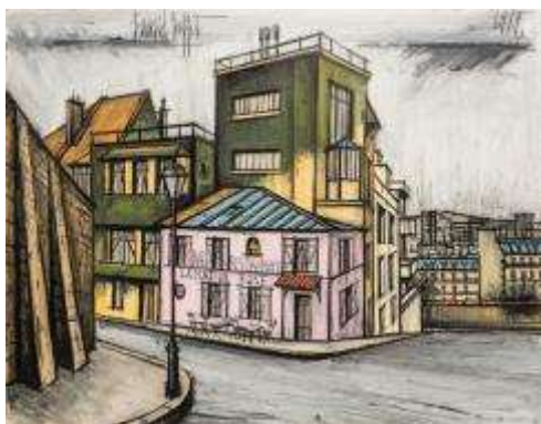
Bernard Buffet La maison rose à Montmartre , 1989 Huile sur toile, 114 x 146 cm Collection Galerie Tamenaga, Paris