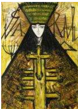
Bernard Buffet Sarah , 1965 Huile sur toile, 130 x 90 cm Collection particulière

Du 18 octobre 2016 au 5 mars 2017 Musée de Montmartre Jardins Renoir 12, rue Cortot – Paris